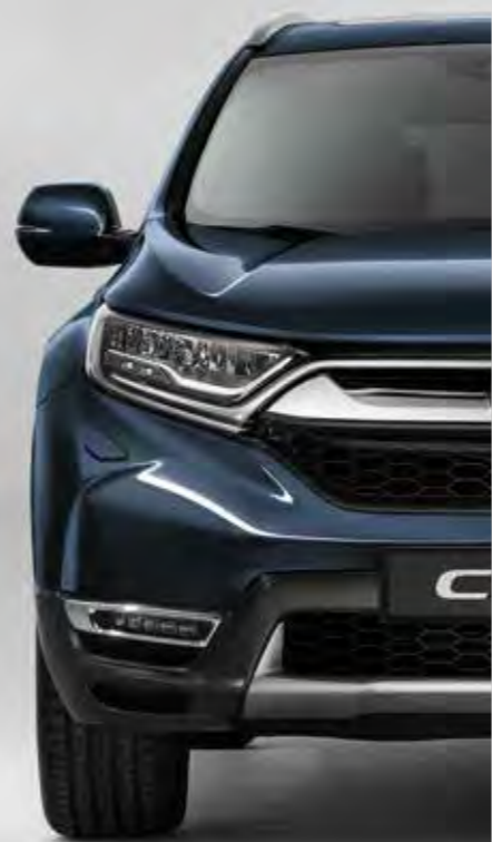
METALICKÁ COSMIC BLUE