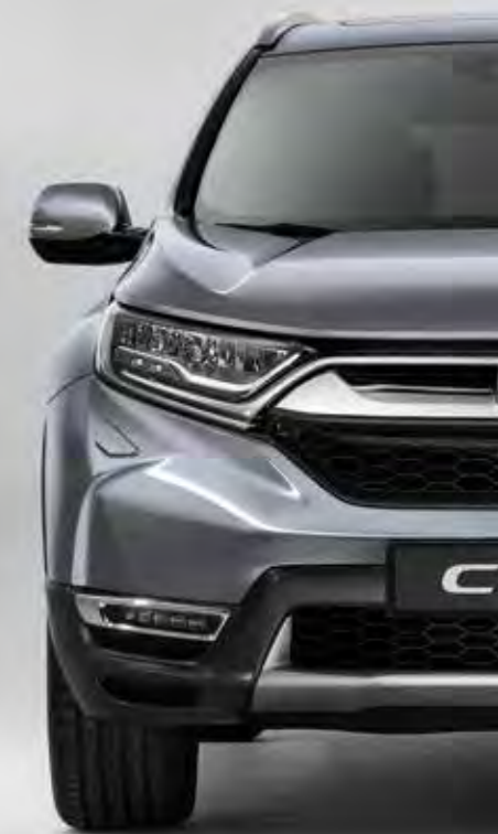
METALICKÁ LUNAR SILVER