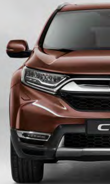
PERLEŤOVÁ PREMIUM AGATE BROWN