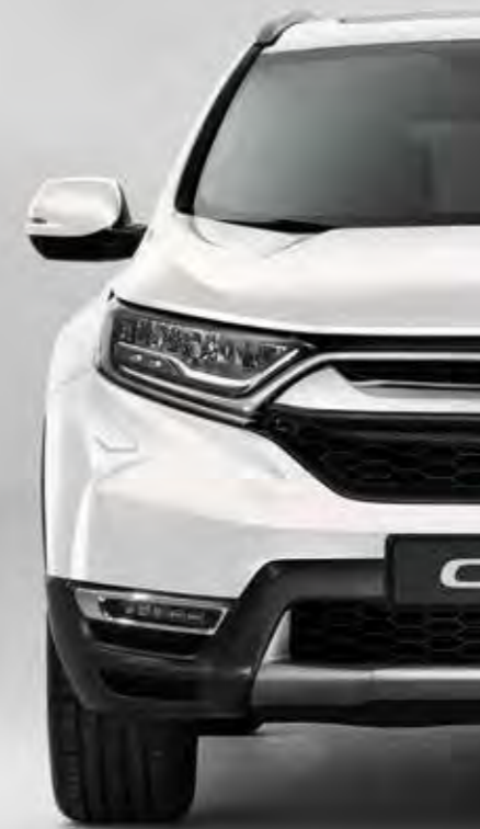
PERLEŤOVÁ PLATINUM WHITE**