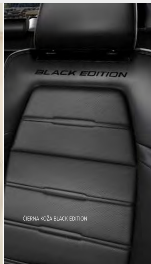
ČIERNÁ KOŽA BLACK EDITION