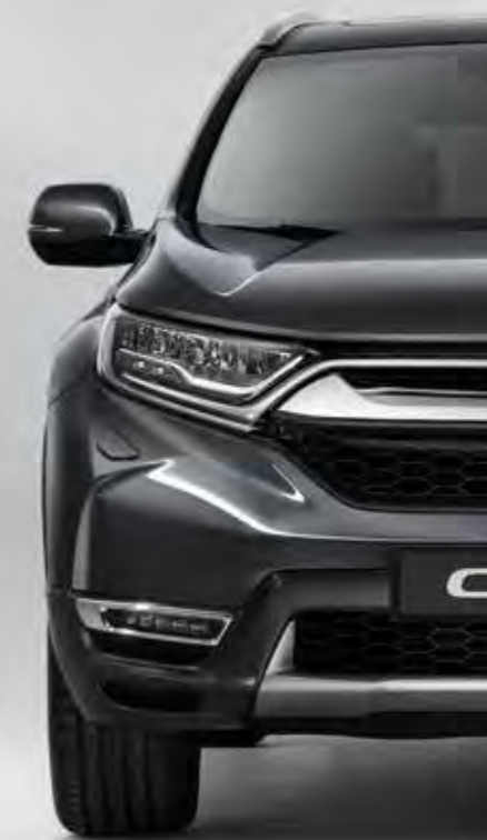
METALICKÁ MODERN STEEL