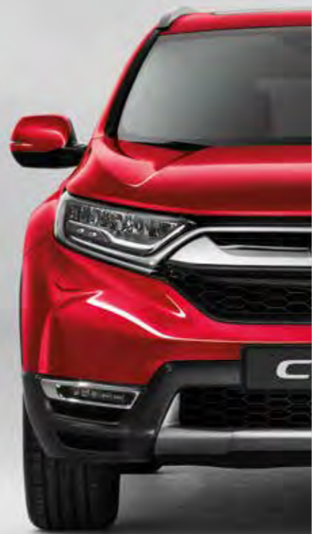
METALICKÁ PREMIUM CRYSTAL RED*

Každá farba je výsledkom úsilia o dokonalý štýl modelu CR-V. Stačí si už len vybrať tú pre seba.